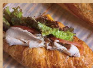
クロワッサンのサンド CROISSANT SANDWICH