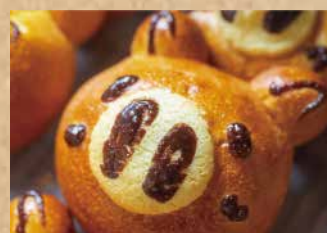
どうぶつチョコパン CHOCOLATE BREAD