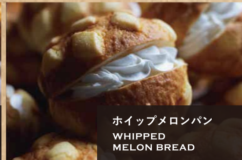
ホイップメロンパン WHIPPED MELON BREAD