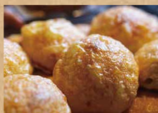
エメンタルチーズ のパン PAIN AU FOMAGE