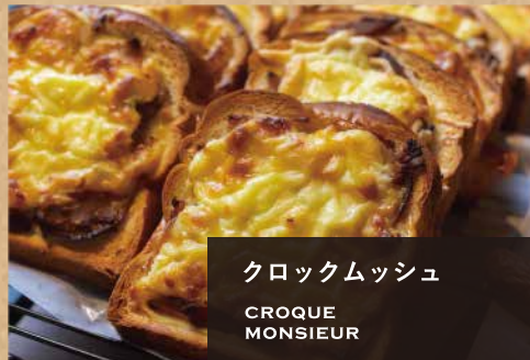
クロックムッシュ CROQUE MONSIEUR