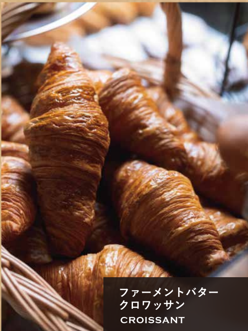
ファーマントバター クロワッサン CROISSANT

フランスの伝統的な製法で焼き上げた「ファーマントバタークロワッサン」や「バゲット」。 ブランド豚「平田牧場金華豚・三元豚」の精肉やハム・ソーセージを使用したオリジナルの惣菜パンも提供いたします。 毎日の朝食やランチはもちろん、日和山公園でのピクニックにもおすすめです。